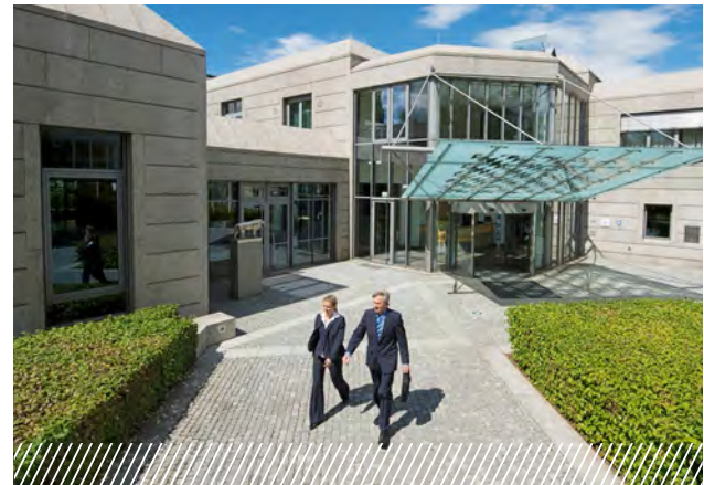
Centro de Convenciones Múnich