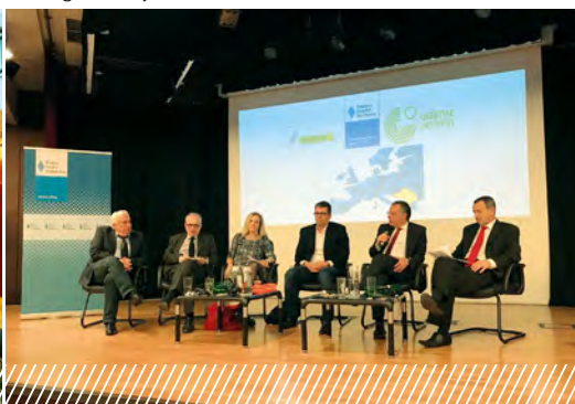
Simposio alemán-griego en Atenas sobre la seguridad y la estabilidad en los Balcanes