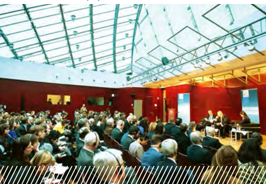
Mesa redonda en Bruselas sobre el papel de los Balcanes