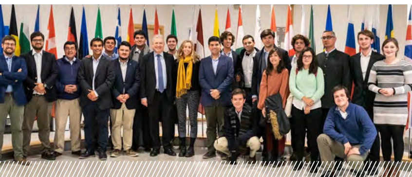
Delegación de Chile sobre "Las instituciones de la UE y la evolución actual de la UE" de visita en Bruselas