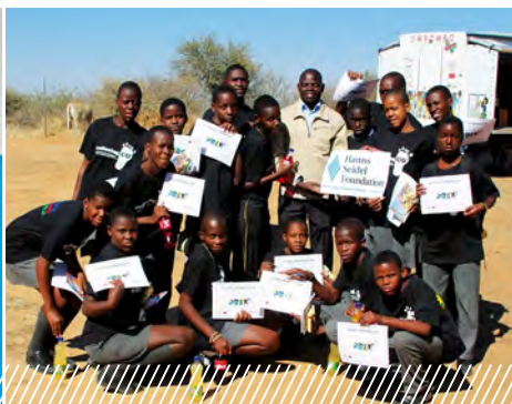
Participantes de un evento de FHS en Namibia sobre energías renovables y eficiencia energética