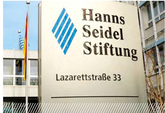
Sede de la fundación, Múnich