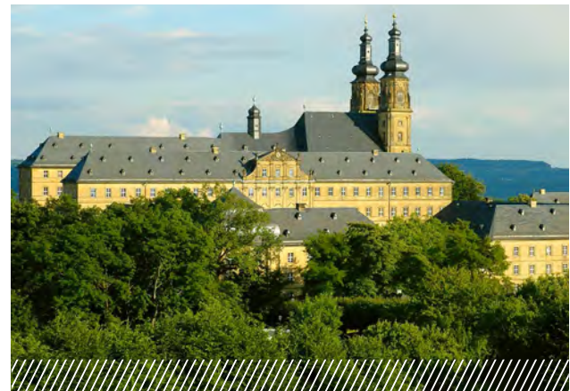
Centro Educativo Kloster Banz (antiguo monasterio)