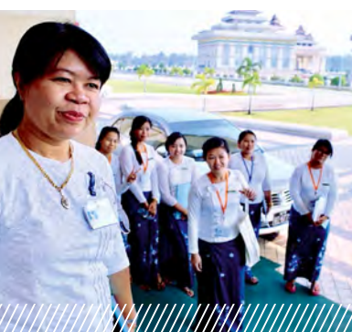
El parlamento cercano al ciudadano en Myanmar – el desarrollo de un servicio de visitas