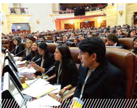
Una mirada a la labor del Parlamento en Colombia