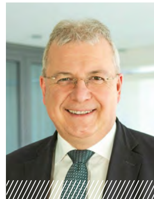
Markus Ferber, MPE Presidente

La misión y los objetivos deben ser perseguidos de manera consistente. Las estructuras deben ser revisadas, los procesos corregidos, los nuevos formatos desarrollados e introducidos. La digitalización también es cada vez más importante para la educación política. Aquí nos vemos en un muy buen camino. Los seminarios online no sustituyen a los seminarios presenciales, pero complementan nuestra oferta de manera decisiva. De esta manera generamos nuevas formas de llegar a grupos jóvenes. La participación en el debate sociopolítico, el diálogo con los diversos grupos de interés y la elaboración de estrategias de solución son algunas de nuestras tareas, que siempre cumplimos (inter)nacionalmente al servicio de la democracia, la paz y el desarrollo. El presente folleto tiene por objeto ofrecer una visión general y compacta de estas amplias actividades de la Fundación Hanns Seidel.